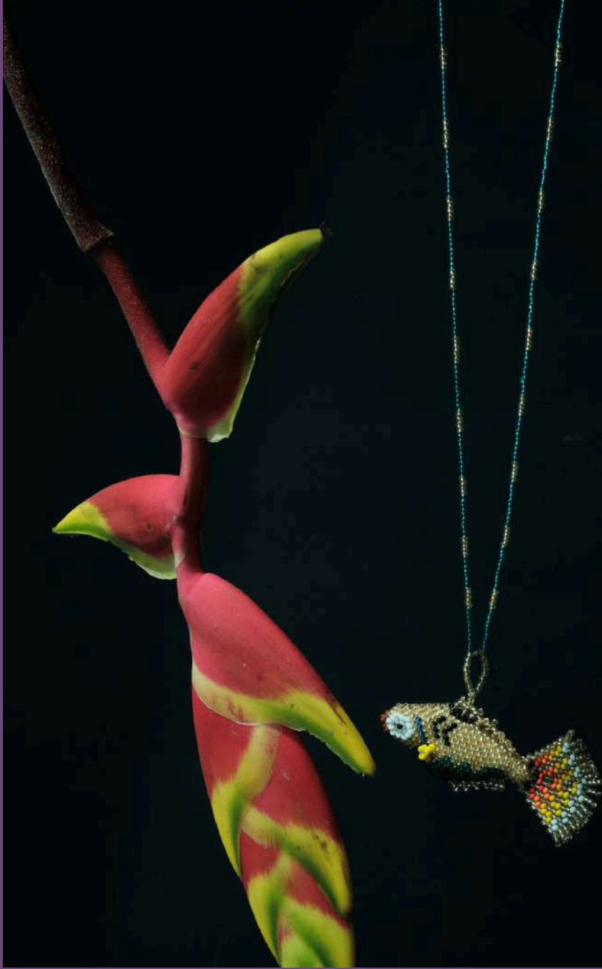
Collar con dije de pez: $80.000 Tejedora: Lucía Nariquiaza