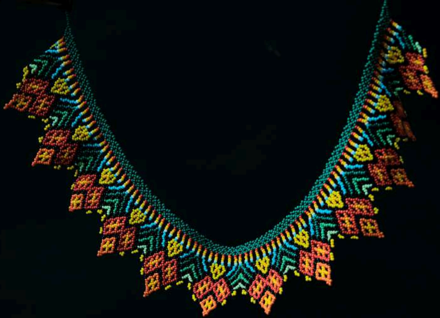
Collar tejido: $120.000 Tejedora: Claudia Machuca