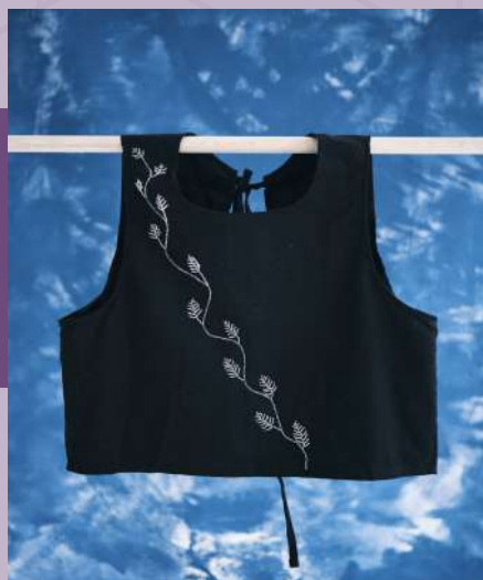
Blusa Estrella del Cielo: $168.000 Tejedora: Rosalbina Machuca