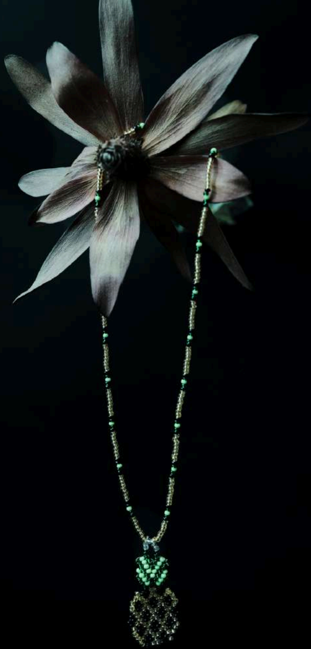
Collar con piña: $80.000 Tejedora: Marisol Velázquez