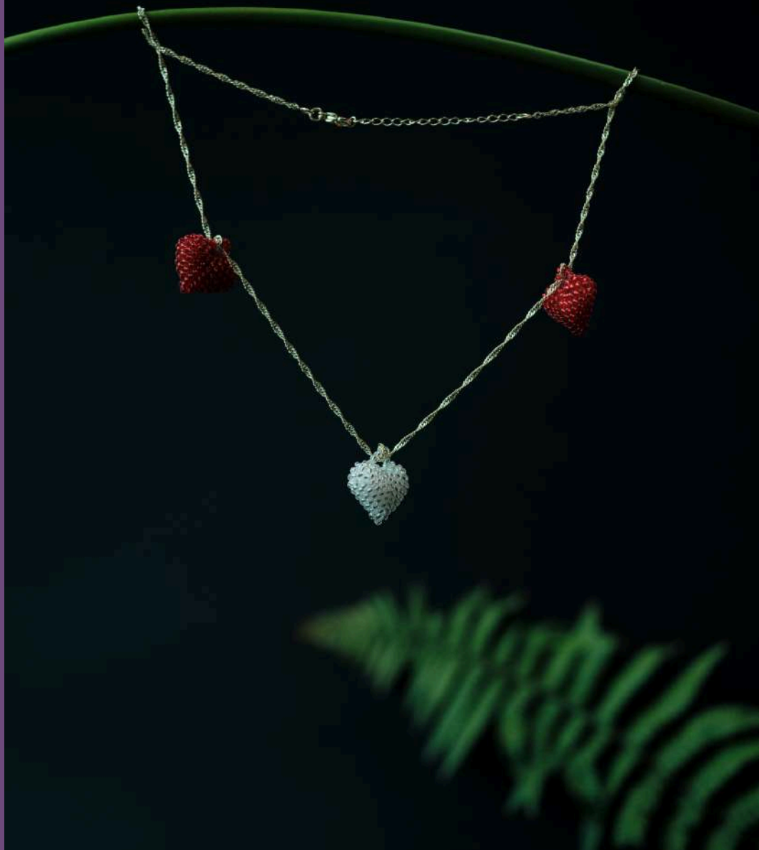
Cadenilla con tres dijes de corazones: $120.000 Tejedora: Clemencia Machuca