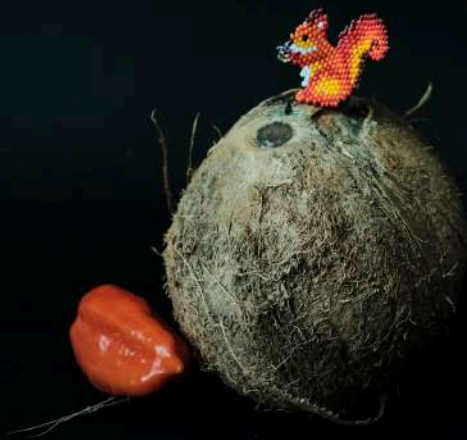
Prendedor de ardilla: $50.000 Tejedora: Tatiana Guasiruma