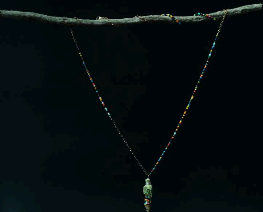
Cadenilla con dije de maíz de colores: $80.000 Tejedora: Claudia Machuca