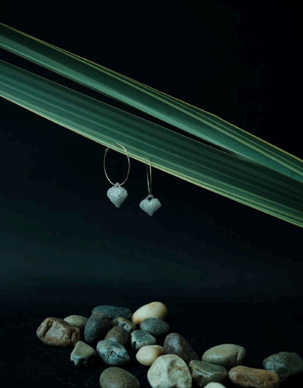
Aretes tipo candongas con dijes de corazón: $80.000 Tejedora: Clemencia Machuca