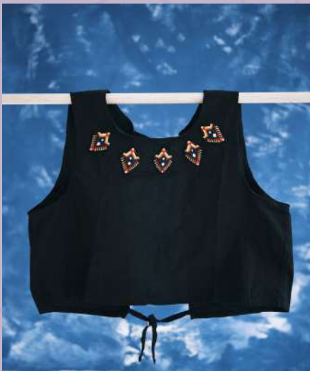
Blusa Planta de Monte: $127.000 Tejedora: Tatiana Guasiruma